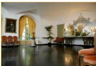
3. Sala delle Ardesie