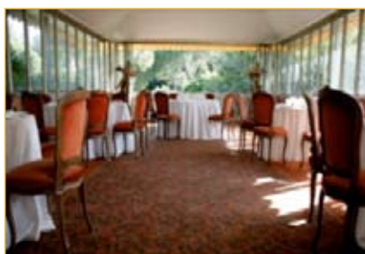
5. Terrazza coperta