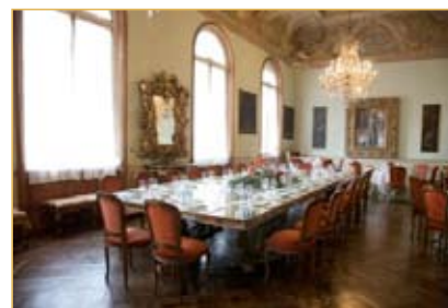
4. Sala degli Specchi