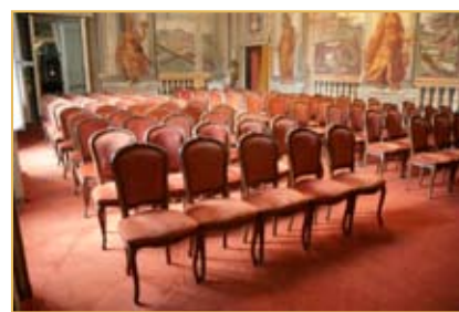
7. Sala degli Affreschi